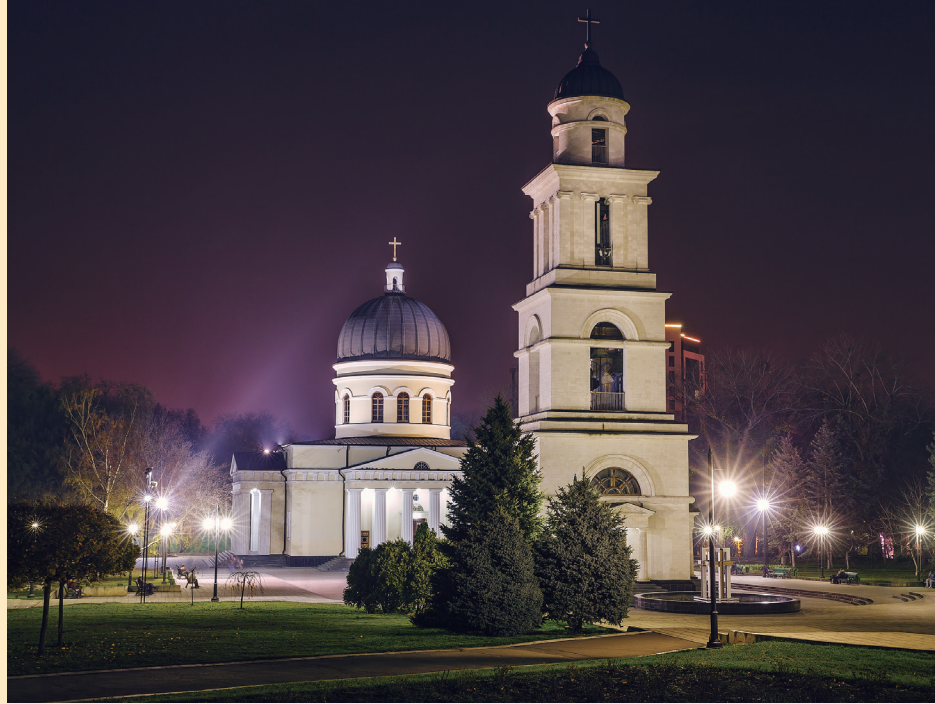
首都キシナウの中心にあるロシア正教の大聖堂です。

私たち日本モルドバ友好協会は、日本とモルドバの国際交流を推進し社会貢献を目的としています。兵庫県民のみな様に広くモルドバを知っていただくとともに、今後の日本とモルドバの経済交流を願って、展示会およびセミナーを開催します。展示物はモルドバの文化・自然・人物等の写真や絵画、経済指標・歴史地図・後援団体の活動紹介パネルなど約30点です。ご自由にお楽しみください。