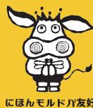
にほんモルドバ友好

開催場所 (公財)兵庫県国際交流協会 ひょうご国際プラザ交流ギャラリー 神戸市中央区脇浜海岸通1丁目5番1号 (国際健康開発センター2F) TEL: 078-230-3267