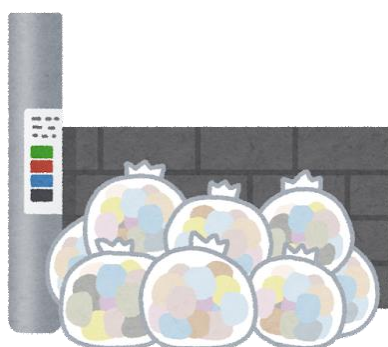
ごみおきば / ごみすてば gomi okiba / gomi suteba 垃圾站