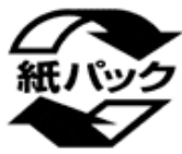
かみパック kami pakku