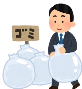
ごみを だします gomi o dashimasu 扔垃圾